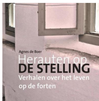
Covers van de vier Stellingboeken